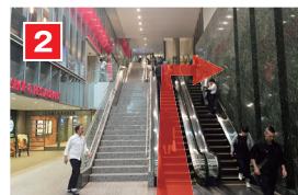
2 3層のエスカレータを1層だけ上がり、直ぐ右折。