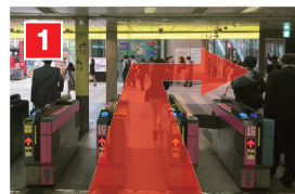
1 六本木一丁目駅中央改札を出てすぐ右へ。